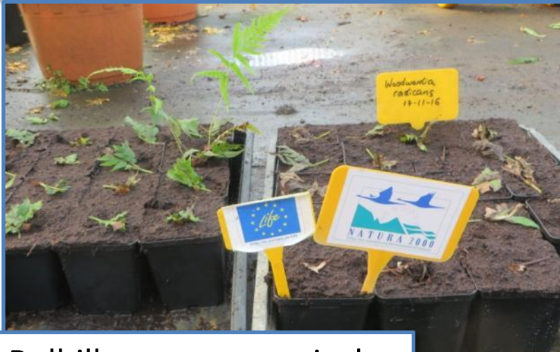
Bulbillos o yemas apicales