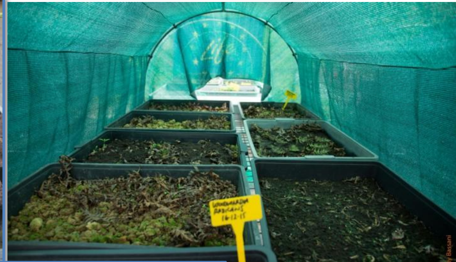
Fronde sobre semillero