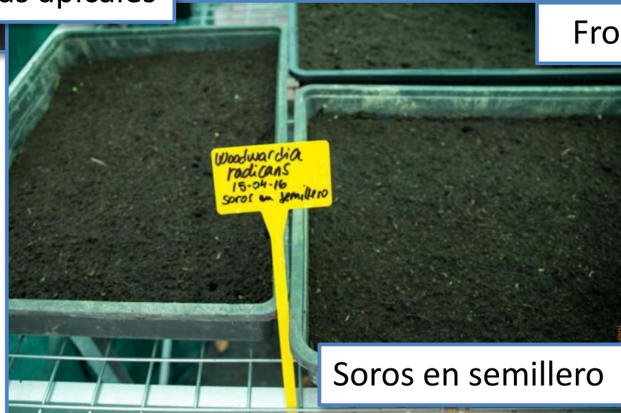
Soros en semillero