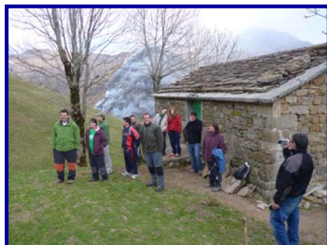
Voluntarios en la finca el Recuesto

A continuación se detallan algunas de las nuevas actividades para 2010: