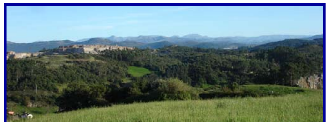
Vista panorámica del Monterín de Igollo de Camargo

Los Pozos de Valcaba, otra de las muestras mejor conservadas del encinar relicto cantábrico.