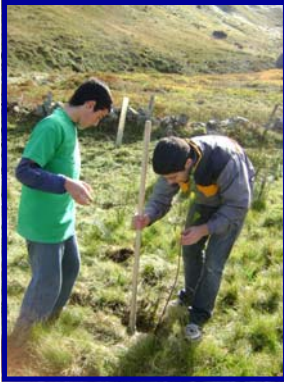
Voluntarios repoblando en el Paraje Valbuena