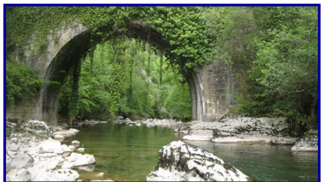
El río Miera a su paso por el puente viejo

Jornada durante el fin de semana, para que pueda acudir el mayor número de público posible.